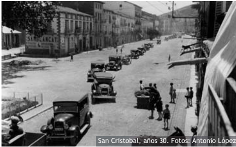
San Cristóbal, años 30.

Con julio emprençia la temporada de verano, la caloreta de meses atrás se ha convertiu en calorota, y hem cambiáu el frío per la fresca...Dinantes, eba tiempo de treballo pa los llabradós, ara tamé lo é pa las explotacions turísticas de la redolada. Y tanto antes como ara, ñabeba y ñai tiempo pa descansá y distrae-se. Este mes se celledra San Cristóbal en Graus - allá en tiempos tamé se celledraba en Ixep, pero se ha perdiu -. Torrodésera y Torres del Obispo celledran las suyas fiestas patronals en honó de Santiago, y Santa Ana.