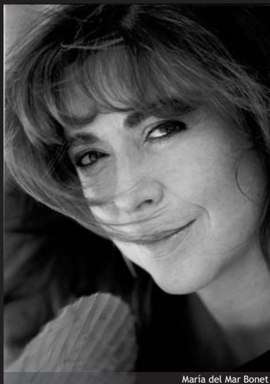
María del Mar Bonet