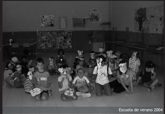
Escuela de verano 2004