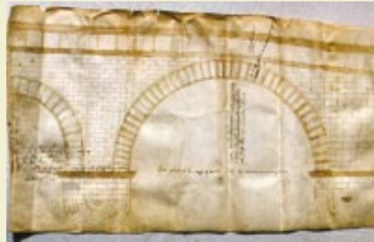
Plano del Puente de Abajo. S. XVI y XVII.

Conocido como Pontarrón, Puente de la Magdalena, de la Cruz o de Abajo es el único puente antiguo que ha sobrevivido en Graus. Se levanta sobre las aguas del Ésera, como otros que hubo en el pasado, poco después de la afluencia del Isábena, en el camino que lleva a Benabarre. El de Santa Bárbara o de Arriba, destruido y sustituido no hace tanto por la moderna pasarela de la carretera que se interna por el Valle del Isábena, era similar. Remontando algo más el cauce estuvo el de Cimolas, coetáneo del primer Pontarrón que se construyó al poco de la conquista cristiana de Graus (1083) y desaparecido ya en la Baja Edad Media. Éste cabe situarlo en el siglo XVI, aunque tipológicamente mantiene las pautas de los últimos modelos medievales, con calzadas más anchas y, eso sí, sin presencia de arcos ojivales.