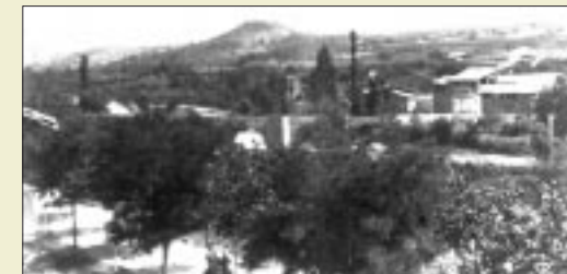
Puente de Santa Bárbara, desaparecido.