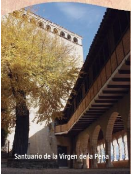
Santuario de la Virgen de la Peña