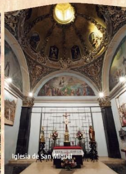
Iglesia de San Miguel