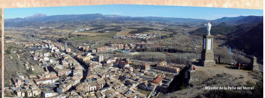
Mirador de la Peña del Morral