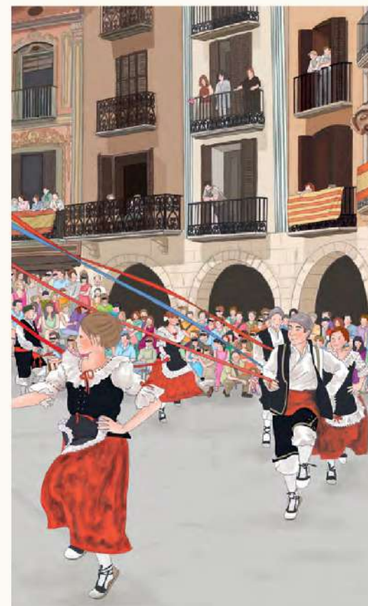
Eleuterio Pueyo Ilustraciones de Emeri Mur