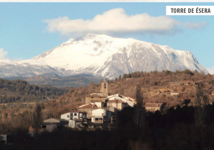
TORRE DE ÉSERA

Pertenece al abadiado de San Victorián, de donde tomó su nombre. El conjunto poblacional tiene buenos ejemplos de arquitectura tradicional como Casa Mazorra. La iglesia de Ntra. Sra. de Gracia es de factura moderna. Junto a ella la interesante cruz de término, obra del siglo XVI.