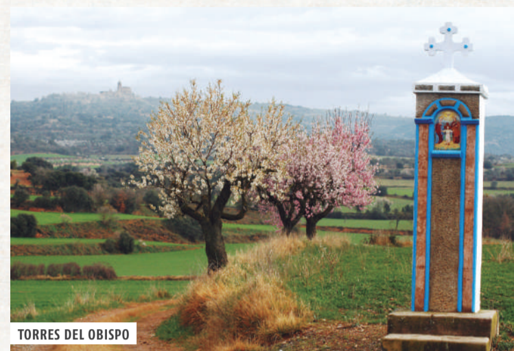
TORRES DEL OBISPO